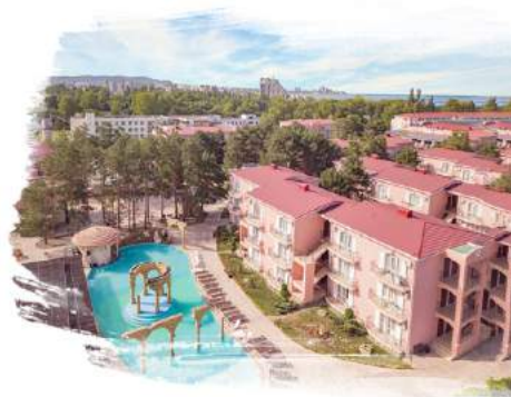
Alean Family Resort & Spa Riviera 4* / Анапа