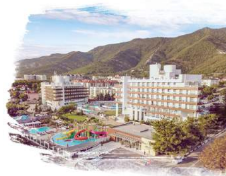
Alean Family Resort & Spa Biarritz 4* / Геленджик