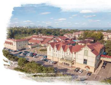
Alean Family Resort & Spa Doville 5* / Анапа

Курорты сети Alean Family Resort Collection ориентированы на семейный отдых с детьми и единственные на черноморском побережье России работают в формате «Ультра все включено». На начало 2018 года бренд объединяет 4 средства размещения: