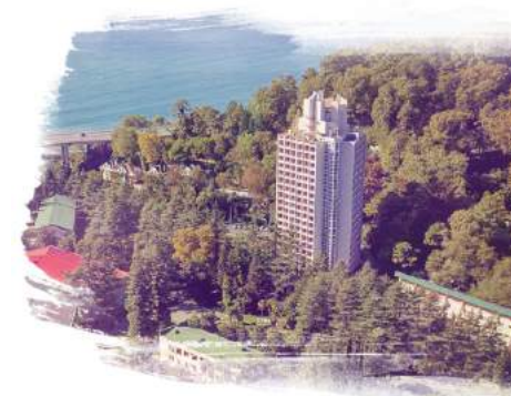
Alean Family Resort & Spa Sputnik 3* / Сочи